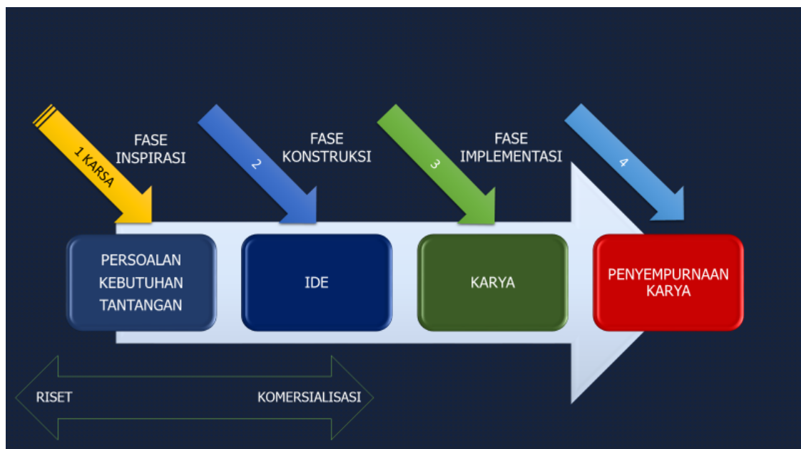
Gambar 2. Bagan alir proses konstruksi ide dalam PKM-KC

Tahap akhir PKM-KC adalah Fase Implementasi di mana produk dapat difungsikan dan dinilai level kemanfaatannya. Dalam kasus tertentu, jika produk PKM-KC belum fungsional, maka paling tidak fase konstruksi sudah harus tercapai dan dilakukan uji coba (lihat Gambar 2.).